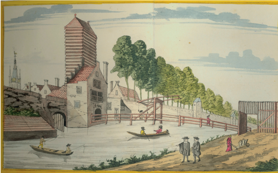
Gezicht op Koepoort en Drogerie, achttiende eeuw

Onze buurt kende vroeger een uitgebreide lakenindustrie. Er zijn nog veel tastbare herinneringen aan deze tak van nijverheid.