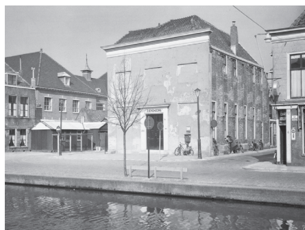
Het voormalige anatomiegebouw in 1958

In 1667 heeft de stadsanatom Cornelis 's-Gravesande het lijk van een moordenaar uit Geervliet ontleed om het geraamte daarna voor studiedoeleinden te kunnen gebruiken. Na afloop van de sectie moest het overschot ter aarde worden besteld;